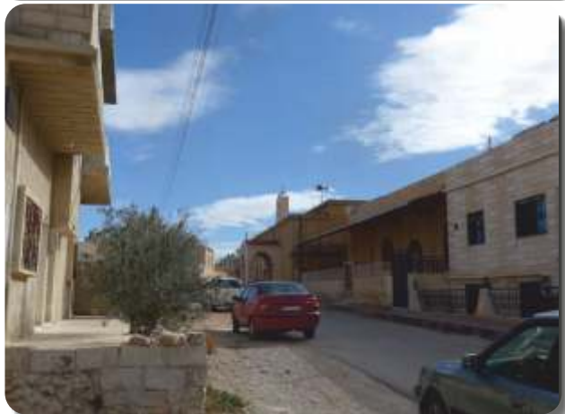
A dzsihadisták két támadása után Szadadban ismét nyugalom honol. CSI