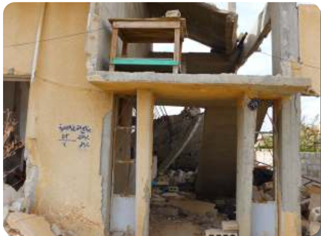
A dzsihadisták Szadad egy részét elpusztították. CSI

erőszakmentes politikai ellenzékéhez, és elindult szülőfaluja polgármesterei székéért a választásokon. És 2011 decemberében győzött! Khalil szerint az ellenzéki győzelem azt bizonyítja, hogy Aszad rezsimje a diktatúra ellenére mégis legalább részben biztosítja a szabad helyi választásokat.